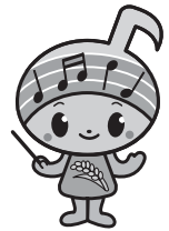
郡山市イメージキャラクター がくとくん