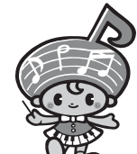
がくとくんの妹 おんぶちゃん